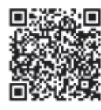
申込フォーム 表示用バーコード